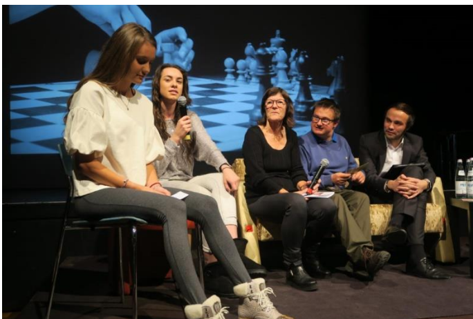
Präsentation und Austausch mit LR Philipp Achammer (2017)