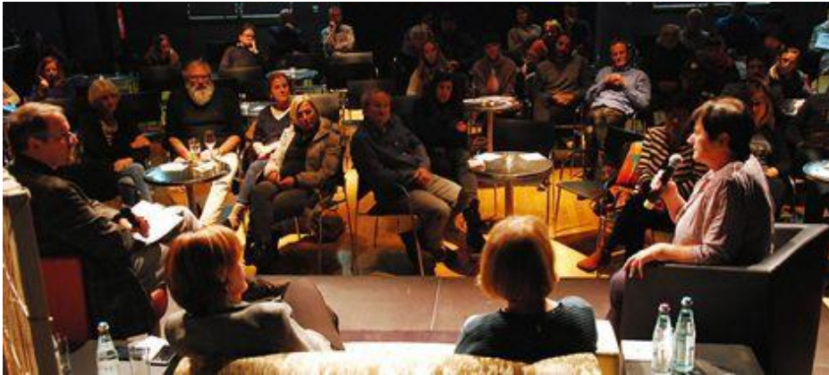
Information schafft die Grundlage für Kooperation

Nutzen Sie diese Gelegenheit und stellen Sie uns Ihre Projekte und Initiativen mit Hilfe des beiliegenden Formulars kurz vor. Eine Arbeitsgruppe wird die Bewerbungen sichten und mit Ihnen in Kontakt treten, um alles weitere zu klären.